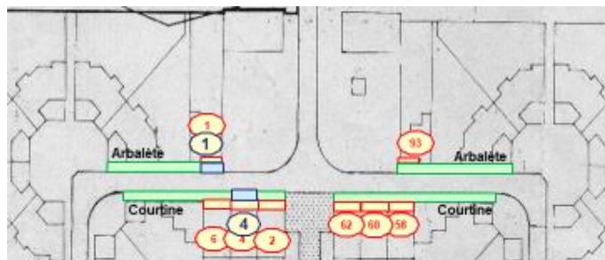
PLAN CHÂTEAU VILLAGE Parcelles zone NORD

Bordures appartenant à la copropriété (entretien sous la responsabilité de l'ASL)