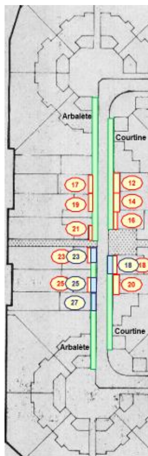
PLAN CHÂTEAU VILLAGE Parcelles zone OUEST

Bordures appartenant à la copropriété (entretien sous la responsabilité de l'ASL)